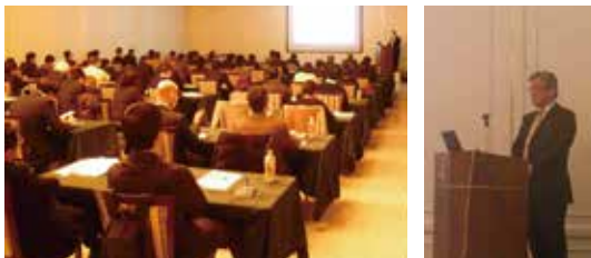
1月23日 岩手県で演説