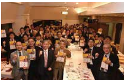
1月26-28日 広島県を訪問、意見交換